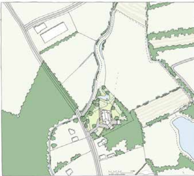
Ontwerp: Buro Poelmans Reesink Landschapsarchitectuur, Van der Linde Architecten

Op deze aspecten hebben de architect en de landschapsarchitect adequaat antwoord gegeven. De basis vormt een landschapsonwerp dat inspeelt op bestaande structuren, natuurwaarden herstelt en inbedding geeft aan de woning. Het woningontwerp vormt een integraal onderdeel van het landschap. Dit blijkt onder andere uit de dominante kap. ■